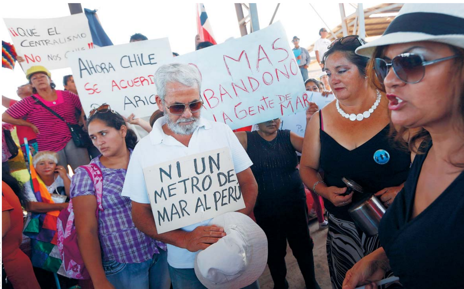
PESE A QUE LOS FALLOS DE LA CORTE INTERNACIONAL DE JUSTICIA DE LA HAYA SON INAPELABLES Y VINCULANTES PARA LOS DOS PAÍSES, LOS HABITANTES DE ARICA EXPRESARON SU DESCONTENTO, EN MEDIO DE DISCREPANCIAS.

Según este dirigente, la mayor parte de la pesca de anchoveta no se verá afectada por la nueva delimitación, aunque los pescadores chilenos deberán renunciar a otras especies que viven en aguas más profundas, como la palometa o el bacalao, que se capturan a entre 60 y 150 millas de la costa.