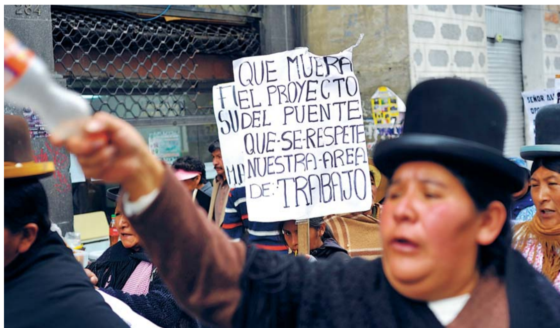
LA MOVILIZACIÓN DE GREMIALISTAS PARALIZÓ EL CENTRO PACEÑO Y EXIGE A LAS AUTORIDADES MUNICIPALES SUSPENDER EL PROYECTO DE MEJORAMIENTO DE LA PLAZA GARITA DE LIMA.