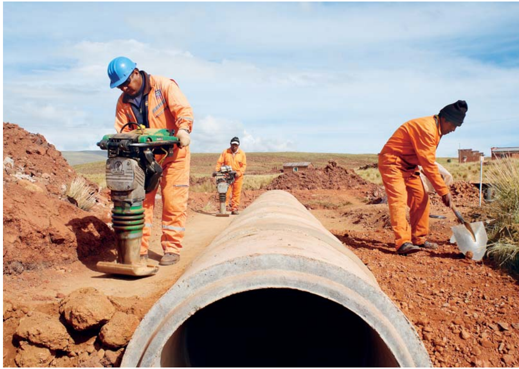
LA LENTA EJECUCIÓN DE OBRAS DEL TRAMO CHAMA - NAZACARA RETRASAN EL INGRESO DE BOLIVIA A PUERTOS DEL PERÚ.

• Hasta la fecha las obras comprenden movimiento de tierra, construcción de puentes y obras menores de drenaje. La vía internacional permitirá conectar por carretera la Sede de Gobierno y el puerto de Ilo distante a 524 kilómetros.