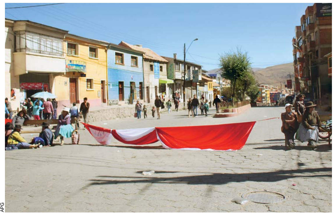
POTOSÍ AMANECIÓ AYER BLOQUEADO, NO HUBO CIRCULACIÓN DE VEHÍCULOS EN SUS VÍAS Y DURANTE LA JORNADA SE DESARROLLARON MARCHAS DE PROTESTA.