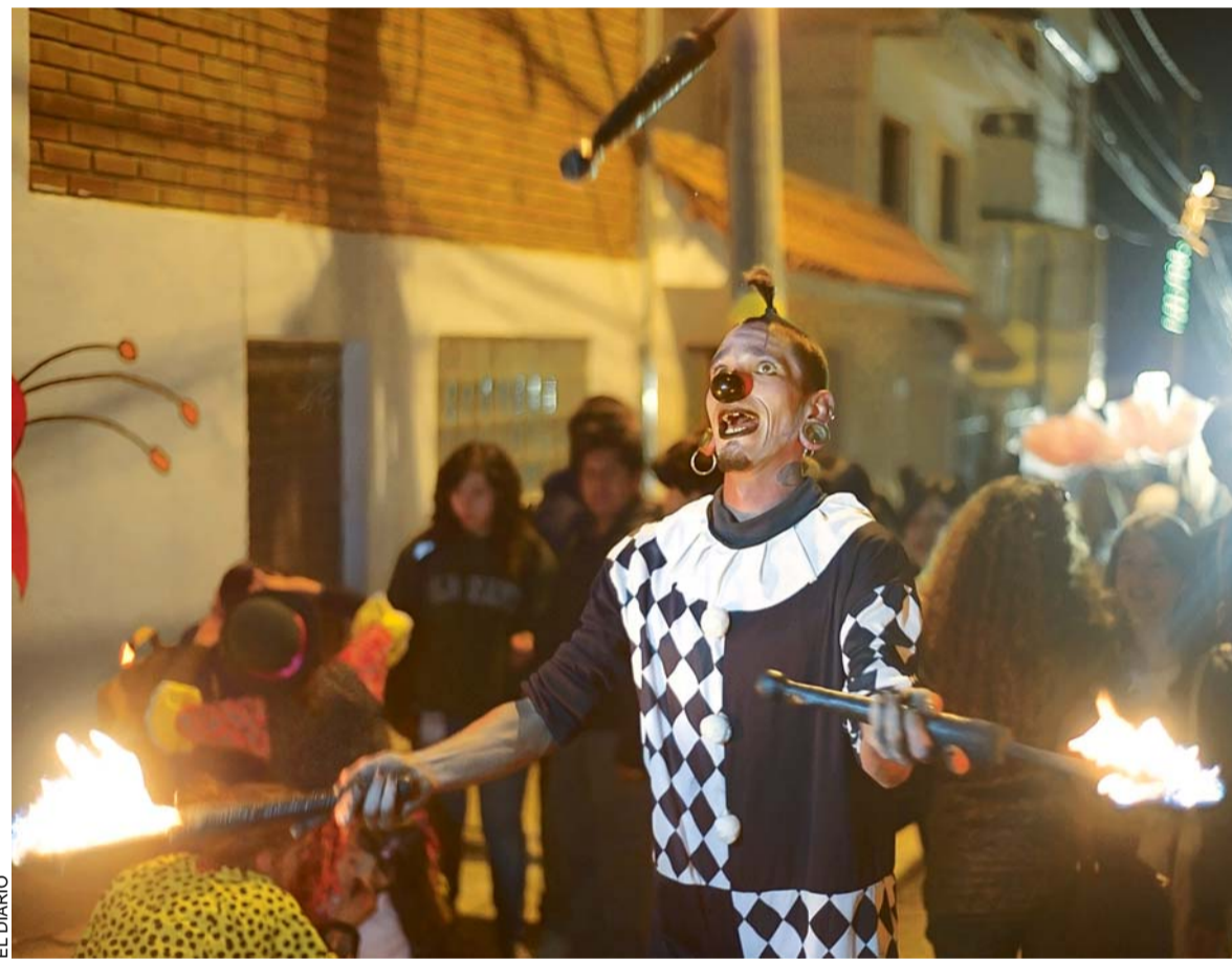
Tribus urbanas conviven en La Paz

Con fines investigativos fueron arrestados dos funcionarios de esa repartición trasladados a la Felcc para proceder a su interrogación a cargo del Ministerio Público.