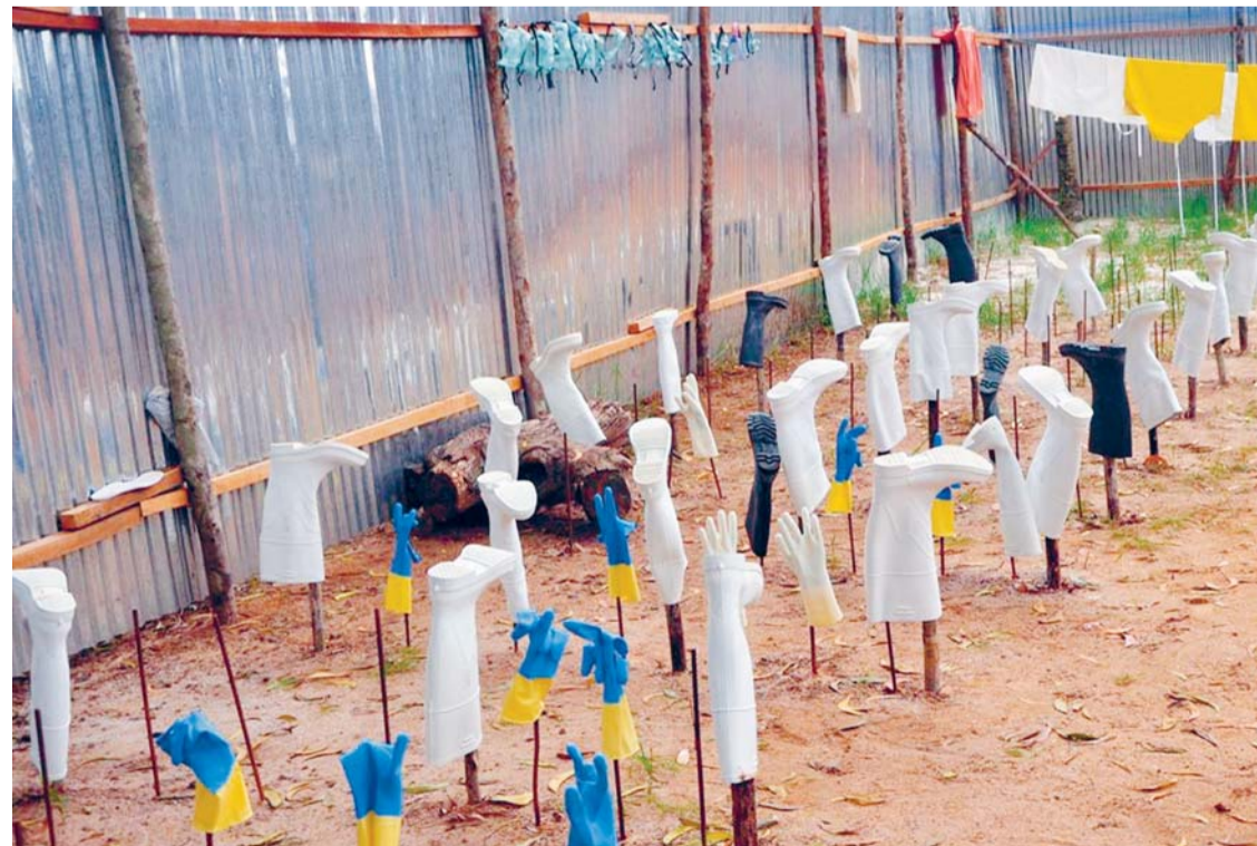
ÁFRICA VIVE SU TRAGEDIA MIENTRAS EL VIRUS ÉBOLA CONTABILIZA HASTA LA FECHA MÁS DE 1.500 VIDAS, ENTRE LAS QUE SE CUENTAN LAS DE CIENTOS DE SANITARIOS QUE TAN SÓLO TRATABAN DE MANTENER CON VIDA A SUS COMPATRIOTAS.