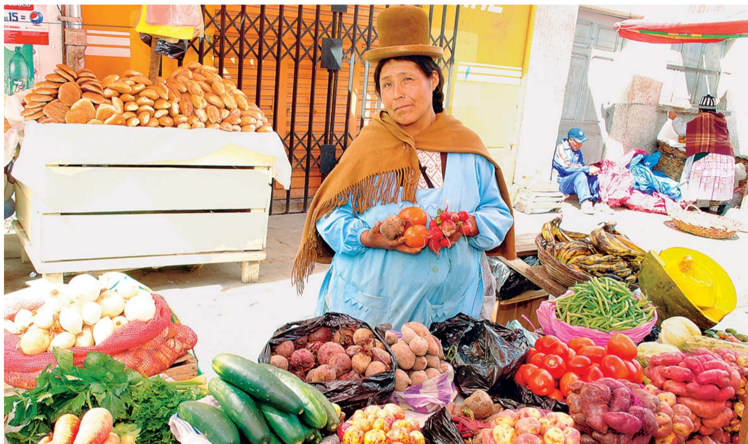
FRENTE A LOS CAMBIOS CLIMÁTICOS EN EL MUNDO, EXPERTOS RECOMIENDAN A GOBIERNOS DE PAÍSES DE AMÉRICA LATINA DAR MAYOR PRIORIDAD A LA PRODUCCIÓN DE ALIMENTOS PARA EVITAR ESCASEZ Y ESPECULACIÓN DE PRECIOS.