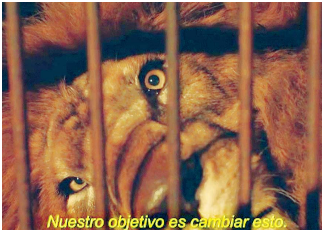
EL 2011 EN EL PAÍS SE VIÓ EL RESCATE DE 25 LEONES DE JAULAS Y MALTRATOS EN LOS CIRCOS, SEGÚN UN DOCUMENTAL.