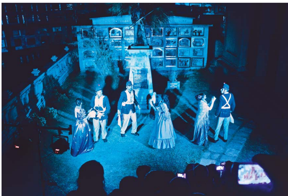
LA CIUDADANÍA PACEÑA VIVIÓ ANOCHE EL EVENTO ESPERADO “UNA NOCHE EN EL CEMENTERIO GENERAL”.

Para el acontecimiento, cuatro decenas de actores de Teatro “Los Cirujas” estuvieron a cargo de 15 escenarios, repartidos en el “Campo Santo de Callampaya”, oportunidad que sirvió para educar a las personas a través del arte. El espacio fue abierto entre las 18:00 horas hasta las 24:00 horas.