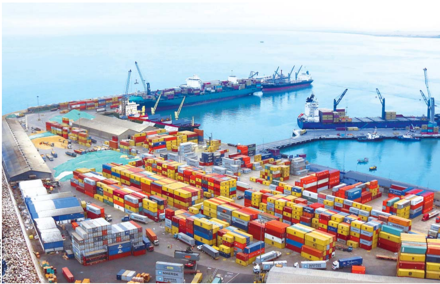
LOS BOLIVIANOS EXPRESARON SU RECHAZO A LOS ARGUMENTOS DE AUTORIDADES CHILENAS, DIVULGADOS A TRAVÉS DE UN VÍDEO QUE NO MUESTRA LA REALIDAD. CHILE, DESPUÉS DE 1904, EN SIETE OPORTUNIDADES SE COMPROMETIÓ A OTORGARLE UN ACCESO SOBERANO AL MAR A BOLIVIA.

En opinión de varios líderes empresariales, consultados por EL DIARIO , al presente Chile incumple sistemáticamente el libre tránsito, contemplado en el Tratado de 1904. La carga boliviana enfrenta una serie de obstáculos administrativos y de logística tanto para exportar a los mercados internacionales como en las importaciones.