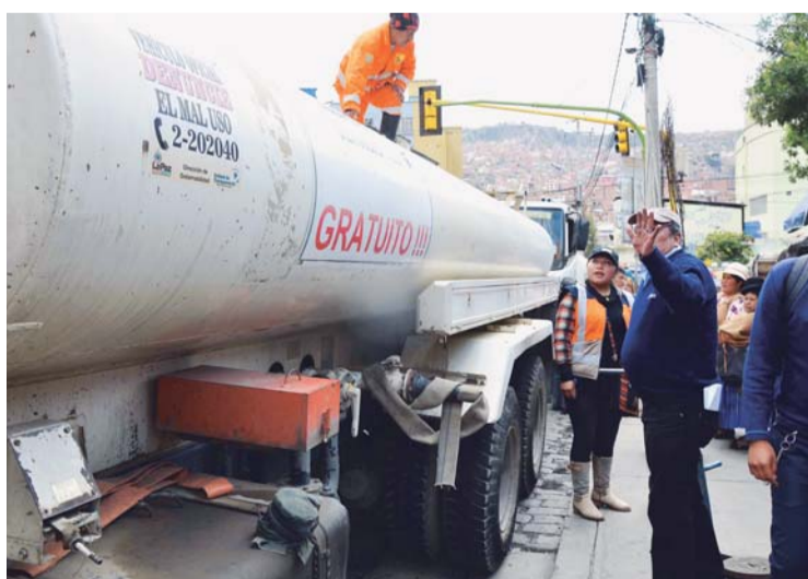
AAPS EJERCERÁ CONTROL SOBRE LA CALIDAD DEL AGUA QUE PROVEEN LOS CAMIONES CISTERNA, ASÍ COMO EL COSTO POR EL SERVICIO.

Frente a las denuncias de los vecinos de diferentes zonas sobre la dudosa calidad del agua distribuida por cisternas, la Autoridad de Fiscalización y Control Social de Agua Potable y Saneamiento Básico (AAPS) regulará a partir de la fecha la provisión mediante cisternas particulares, el costo por el servicio contempla sólo el trans-