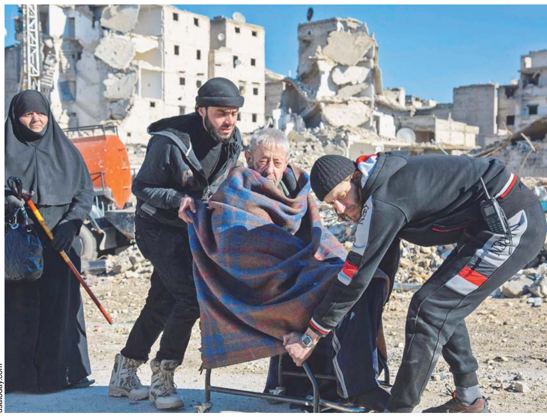
EL CICR, LA MEDIA LUNA ROJA SIRIA Y VARIAS AGENCIAS DE LA ONU SUPERVISAN Y FACILITAN EL PROCESO DE EVACUACIÓN DE CIVILES EN ALEPO.