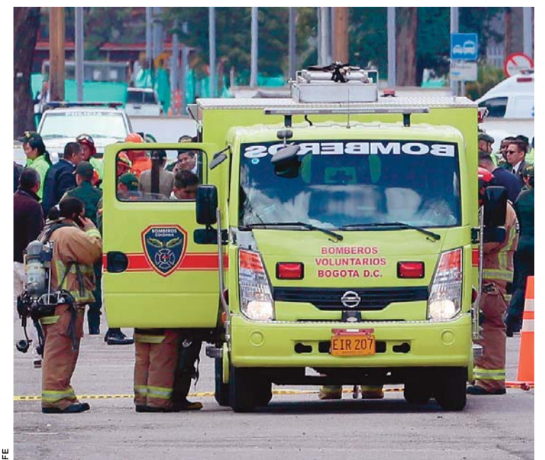
MIEMBROS DEL CUERPO DE BOMBEROS VOLUNTARIOS DE BOGOTÁ TRABAJAN EN EL LUGAR DONDE UN CARRO BOMBA CAUSÓ LA EXPLOSIÓN.

Según la agencia EFE, El Ministerio de Defensa, que inicialmente informó de ocho muertos en el ataque perpetrado pasadas las 9.30 hora local (14.30 GMT), dijo posteriormente que la cifra subió a nueve y que el número de heridos también aumentó.