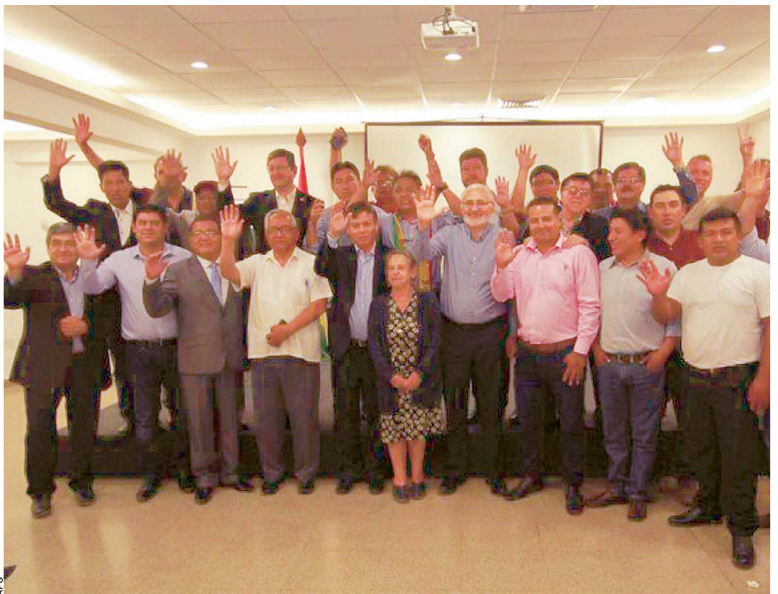
IMAGEN DE LOS PARTICIPANTES EN EL ENCUENTRO REALIZADO AYER EN SANTA CRUZ PARA LA DEFENSA DEL 21F.

"A la población recomendamos que no debe haber contacto con ningún curso de agua por los lixiviados, que son residuos tóxicos de la basura. Ahora mismo estamos verificando la calidad de las aguas con estudios (...). Pero, lo recomendable es que la gente de las zonas cercanas hierva el agua por completo", dijo a la agencia ANF.