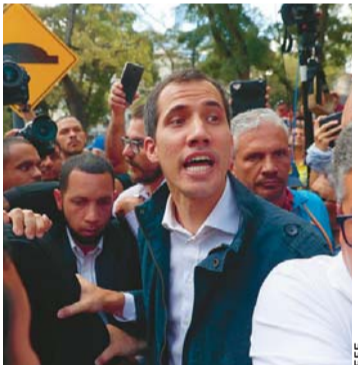
PRESIDENTE DE LA ASAMBLEA NACIONAL (PARLAMENTO) DE VENEZUELA Y AUTOPROCLAMADO PRESIDENTE INTERINO DEL PAÍS, JUAN GUAIDÓ.

"A partir de este momento iniciamos la toma del control progresivo y ordenado de los activos de nuestra República en el exterior, para impedir que en su etapa de salida y no de conforme con todo lo que le han robado a Venezuela, el usurpador y su banda busque 'raspar la olla' y siga robándose el dinero de los venezolanos, financiando delitos a nivel internacional y usando este dinero para torturar a nuestro pueblo, privándolos de los alimentos y medicinas a quienes salen a protestar por sus derechos", se lee en parte del comunicado. (Agencias)