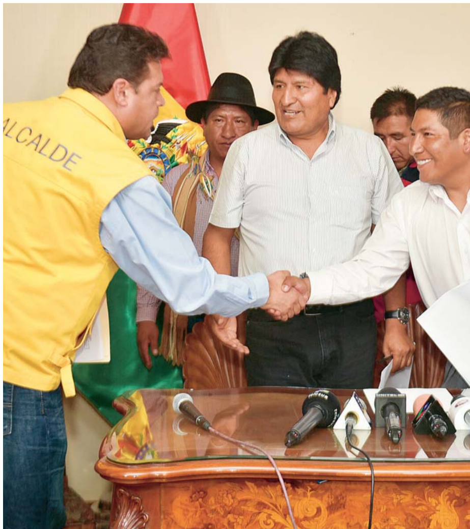
DESPUÉS DE LA FIRMA DEL CONVENIO. FUE AYER EN LA RESIDENCIA PRESIDENCIAL.