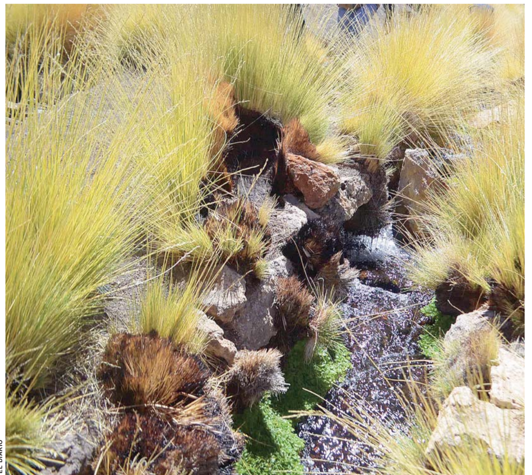
LUGAR DONDE LAS AGUAS MANANTIALES DEL SILALA, EN POTOSÍ, SE DIRIGEN A CHILE POR UN DESVÍO ARTIFICIAL.

Chile demandó a Bolivia en 2016 ante la Corte Internacional de Justicia (CIJ) de La Haya con el objetivo de que ese tribunal declare que el Silala es un "río internacional".