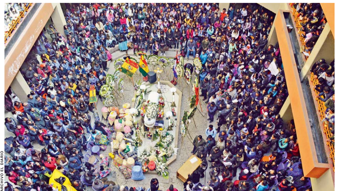
IMAGEN MUESTRA EL DOLOR E INDIGNACIÓN MASIVA QUE CAUSÓ LA MUERTE DEL UNIVERSITARIO. ENTIERRO (MAYO, 2018- EL ALTO).

La familia del victimado expresó su indignación y anunció que apelará la sentencia, mientras que la universidad se declaró en emergencia.