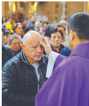
FIELES RECIBIERON CENIZAS PARA REAFIRMAR SU CREENCIA.

Con este resultado consiguió 19 puntos y trepó al segundo puesto de la tabla de valoraciones del torneo del fútbol profesional boliviano que está liderado por Nacional Potosí.