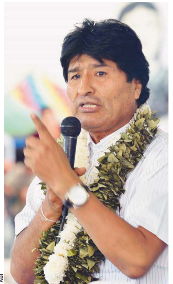
PRESIDENTE EVO MORALES EN CHAPARE.