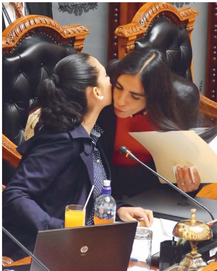
MINISTRA SALUDA A LA PRESIDENTA DE LA CÁMARA DE SENADORES. FUE AYER DURANTE LA INTERPELACIÓN.