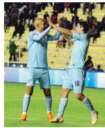
FESTEJO DE LOS BOLIVARISTAS.

Tras golear por 3 a 0 a Oriente Petrolero, anoche, en el estadio Hernando Siles, Bolívar alcanzó la punta en el torneo Apertura del fútbol profesional boliviano.