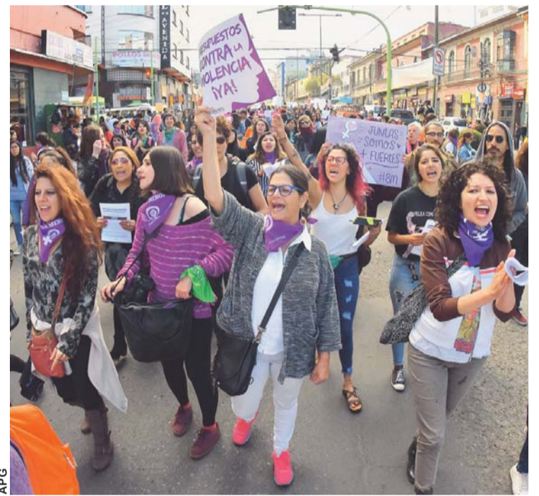
ACTIVISTAS POR LOS DERECHOS DE LA MUJER SE MOVILIZARON EN LA PAZ.