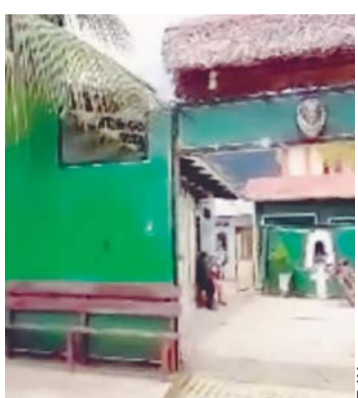
CARCELETA DE RURRENABAQUE.

LA POBLACIÓN SE PREPARA PARA SER PARTE DE LA AFICIÓN DEPORTIVA CONVOCADA POR EL DIARIO, EVENTO QUE FUE FIJADO PARA EL PRÓXIMO DOMINGO, 14 DE ABRIL, Y SE CONSTITUYE EN EL MÁS IMPORTANTE DEL AÑO.