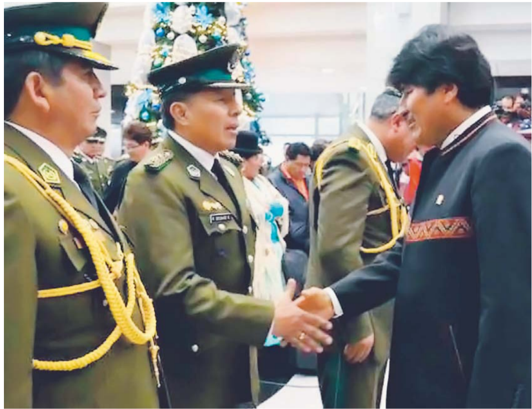
EL PRESIDENTE EVO MORALES EN EL ACTO DE POSESIÓN DE RÓMULO DELGADO COMO NUEVO COMANDANTE GENERAL DE LA POLICÍA.