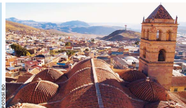
POBLACIONES DE POTOSÍ SINTIERON EL MOVIMIENTO TELÚRICO.