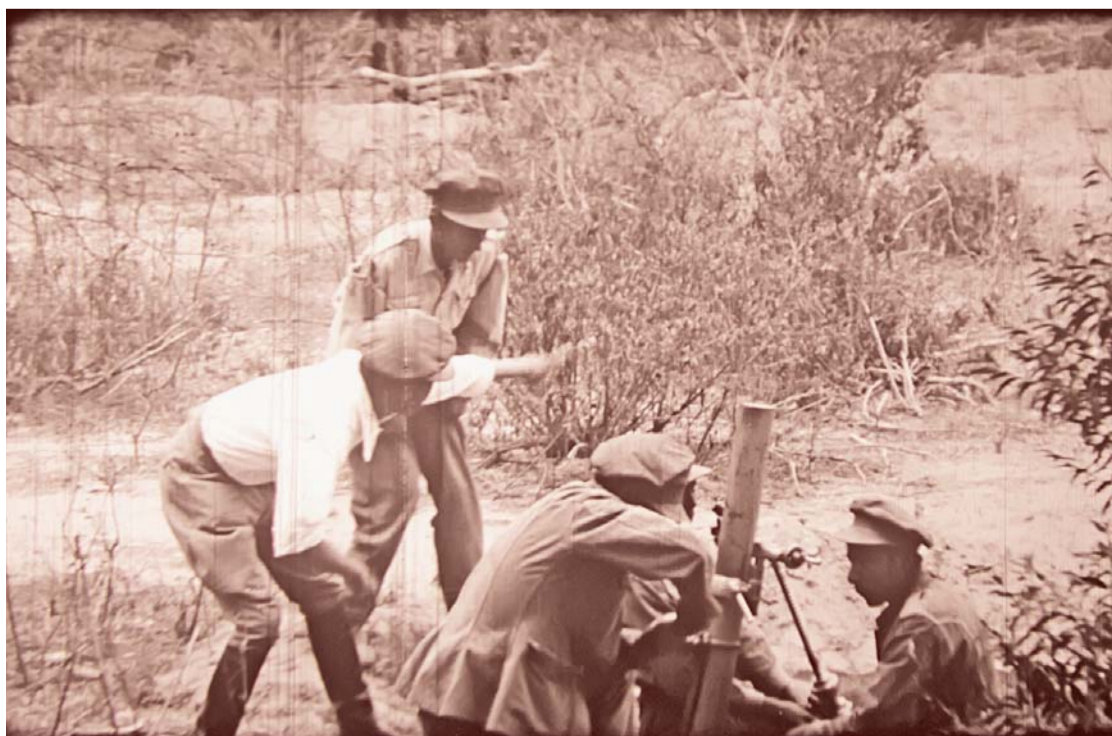
UN EPISODIO DE SOLDADOS BOLIVIANOS EN LA GUERRA DEL CHACO.

El mediometraje es el primer film boliviano que incorpora una banda de sonido a la película, así, se convierte en la primera película sonora nacional. Bazoberry realizó el pionero trabajo técnico de sonorización en España, una vez acabada la Guerra.