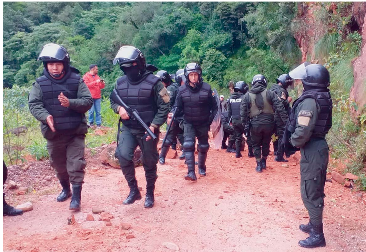
INGRESO DE POLICÍAS A LA RESERVA NATURAL DE TARIQUÍA. FUE AYER EN EL DEPARTAMENTO DE TARIJA.