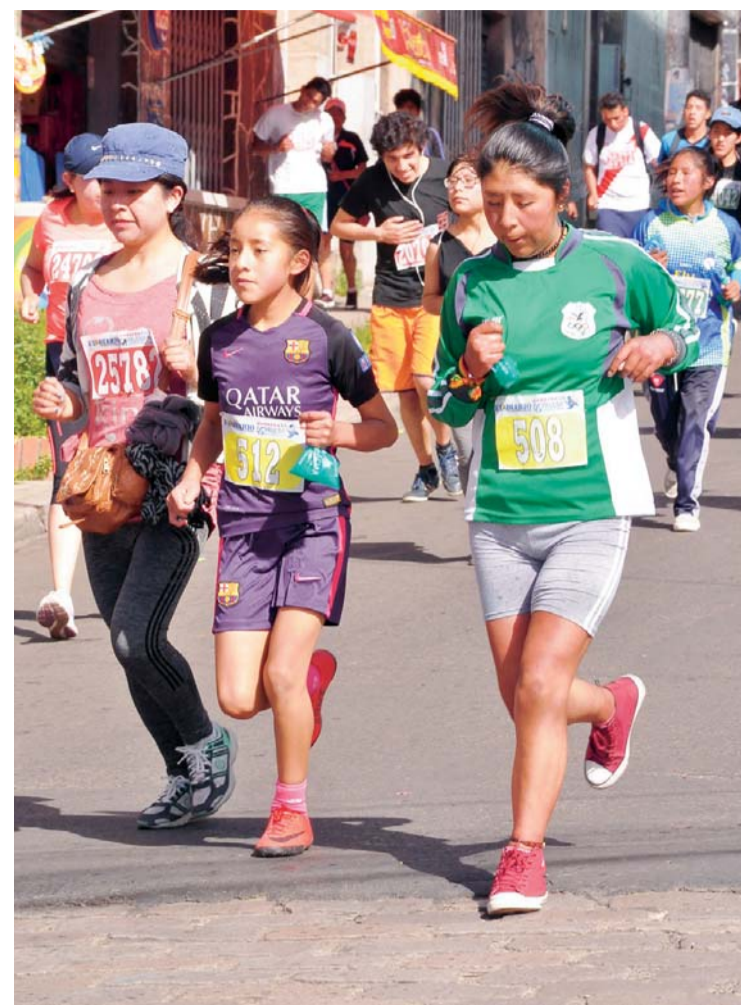
LAS DAMAS SERÁN GRANDES ANIMADORAS EN LA FIESTA DEPORTIVA DE EL DIARIO.