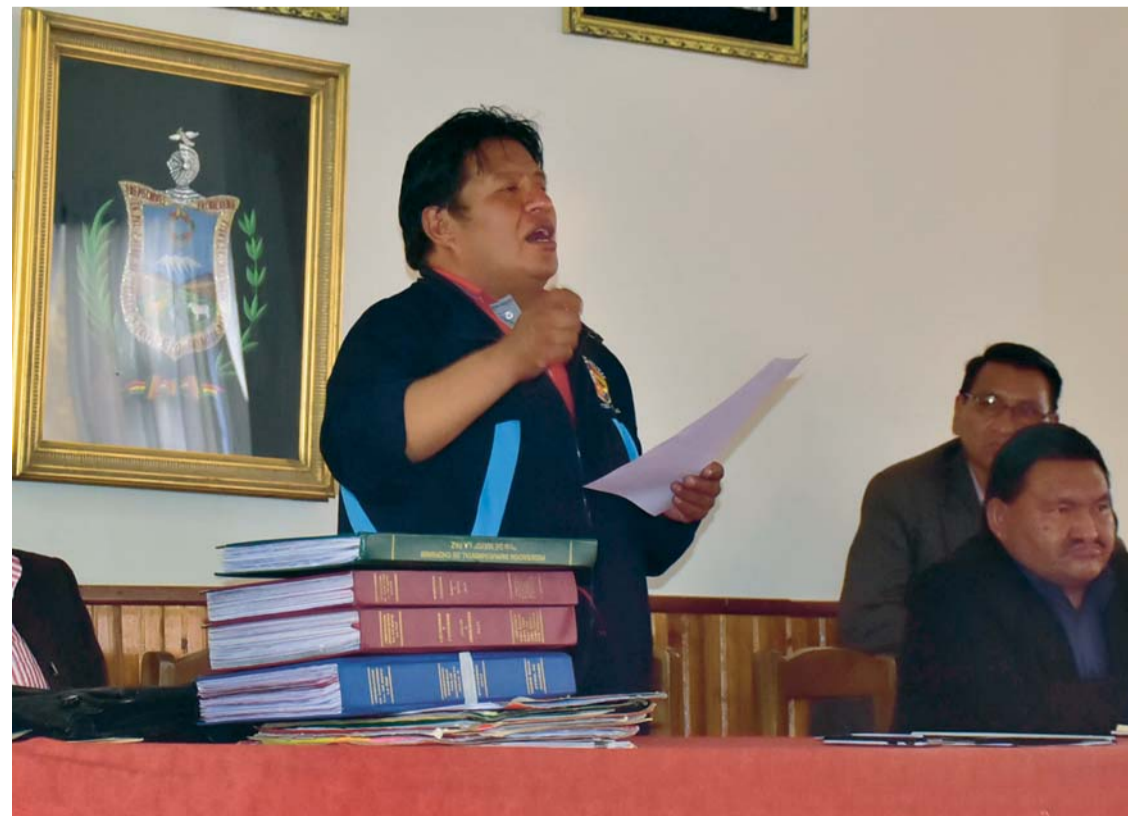
AMPLIADO DE CHOFERES PARA TRATAR EL DESTINO DE FONDOS RECAUDADOS PARA LA SALUD.

> Algunos sindicatos abandonaron el ampliado desarrollado ayer