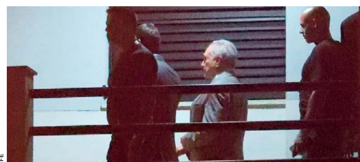
EL EXPRESIDENTE BRASILEÑO MICHEL TEMER LLEGANDO A LA SEDE DE LA POLICÍA FEDERAL DE RÍO DE JANEIRO (BRASIL).

ración Lava Jato, se convirtió en el segundo exmandatario de Brasil en ser detenido en el marco de la mayor operación contra la corrupción en la historia del país, tras Luiz Inácio Lula da Silva (2003-2010).