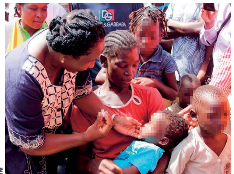
UN NIÑO RECIBE UNA VACUNA CONTRA EL CÓLERA EN BEIRA, MOZAMBIQUE.