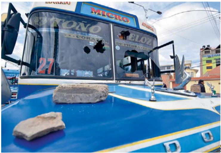
VEHÍCULOS PÚBLICOS QUEDARON DESTROZADOS DESPUÉS DEL INCIDENTE.