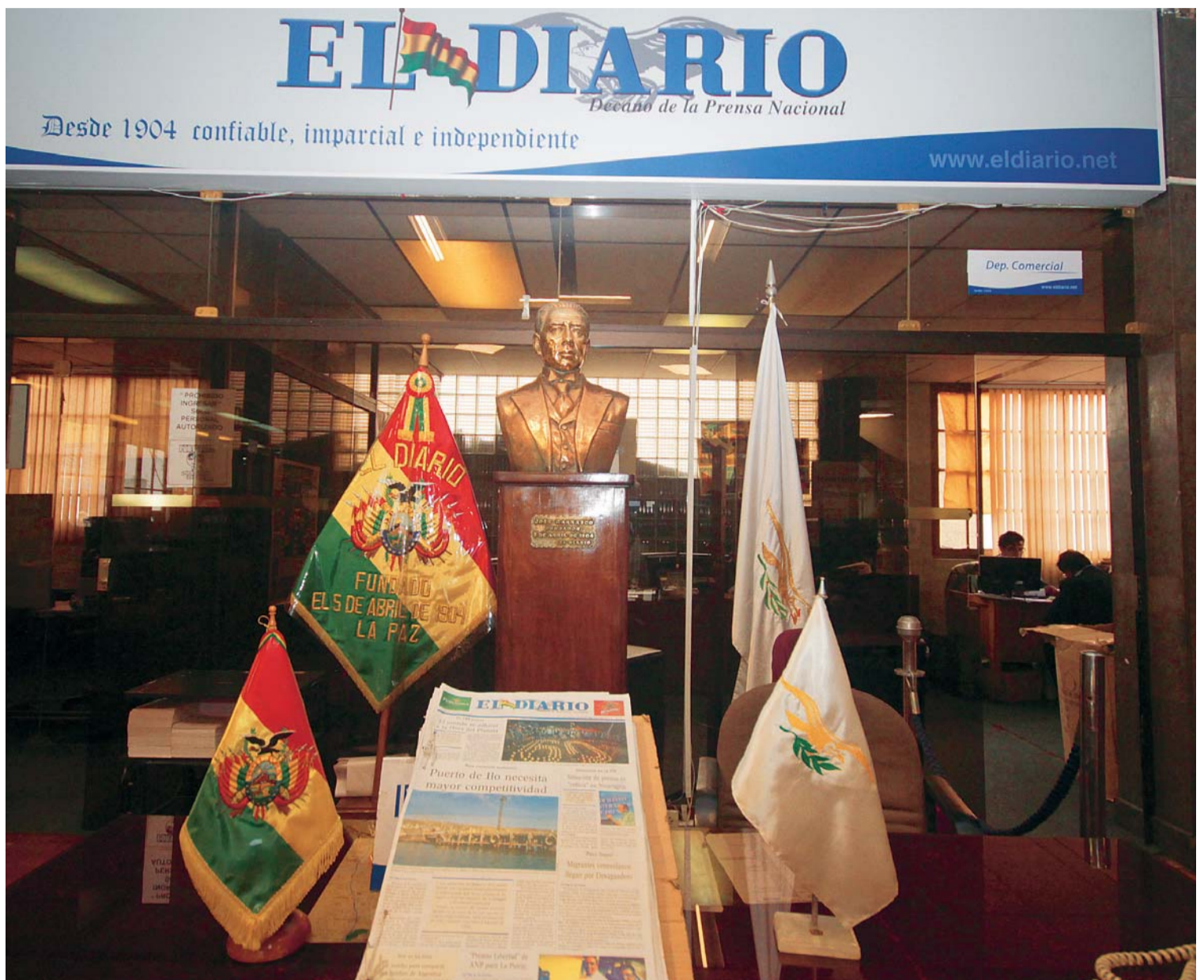
EL DIARIO, INFORMANDO DE MANERA HONESTA, IMPARCIAL E INDEPENDIENTE POR 115 AÑOS Y CON PROYECCIÓN AL FUTURO.

En este nuevo aniversario seguimos firmes, con el compromiso de hacer de Bolivia un país bien informado.