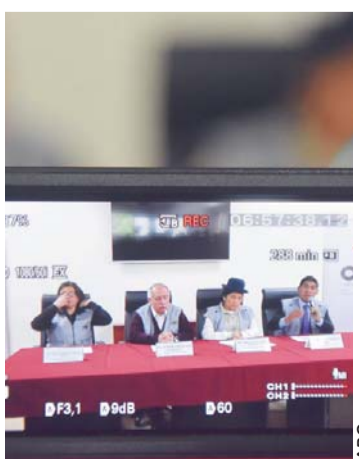
AUTORIDADES DEL TSE.