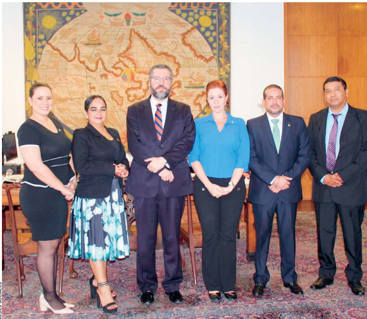
DELEGACIÓN DE BOLIVIA Y AUTORIDADES DE BRASIL, DESPUÉS DE LA REUNIÓN DE AYER EN BRASILIA.

> Comisión boliviana se reunió ayer con el alto funcionario del gobierno de Jair Bolsonaro > El próximo año, la candidatura oficialista no sería reconocida internacionalmente, según experto Álvaro del Pozo