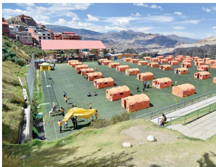
ALBERGUE PARA DAMNIFICADOS DEL DESLIZAMIENTO EN LA CANCHA FIGARO.