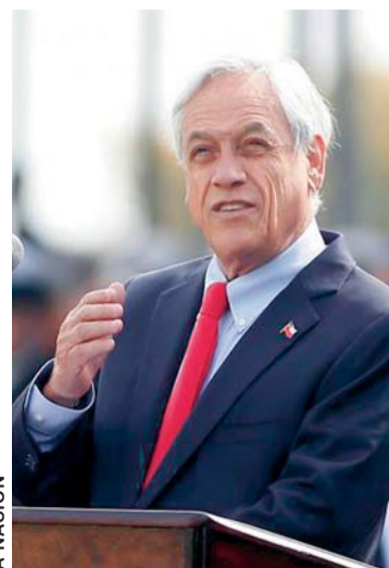
SEBASTIÁN PIÑERA, PRESIDENTE DE CHILE.

"Esta ley va a permitir que cada uno pueda expresar sus preferencias y pueda adecuar con mayor libertad la jornada laboral a esas preferencias", indicó por su parte, durante la presentación de la reforma el ministro de Trabajo, Nicolás Monckeberg.