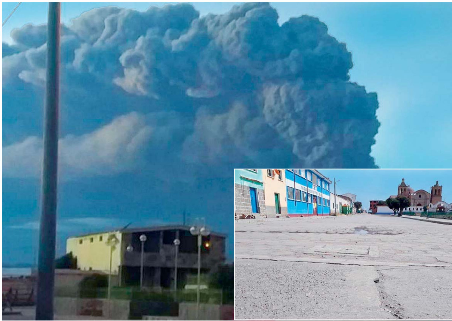
DOS INSTANCIAS DEL FENOMÉNO NATURAL QUE REPERCUTIÓ EN UNA PROVINCIA PACEÑA.