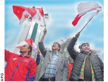
IMÁGENES DE LA JORNADA EN QUE LOS PARTIDOS ENTREGARON SUS LISTAS Y SUS PROGRAMAS DE GOBIERNO ANTE EL TSE.