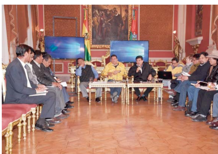
DIÁLOGO ENTRE ALCALDÍA, VECINOS Y CHOFERES SINDICALIZADOS.

"Se ha acordado hacer un cuarto intermedio para que el día lunes se pueda reunir una comisión más pequeña de los vecinos y de la dirigencia de los choferes para establecer el temario de estas mesas de diálogo que van a empezar a trabajar seguramente entre el martes y el miércoles de la próxima semana", explicó el Alcalde al término del encuentro. (AMN)