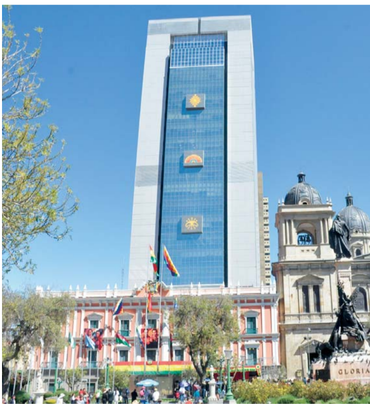
CASA GRANDE DEL PUEBLO.