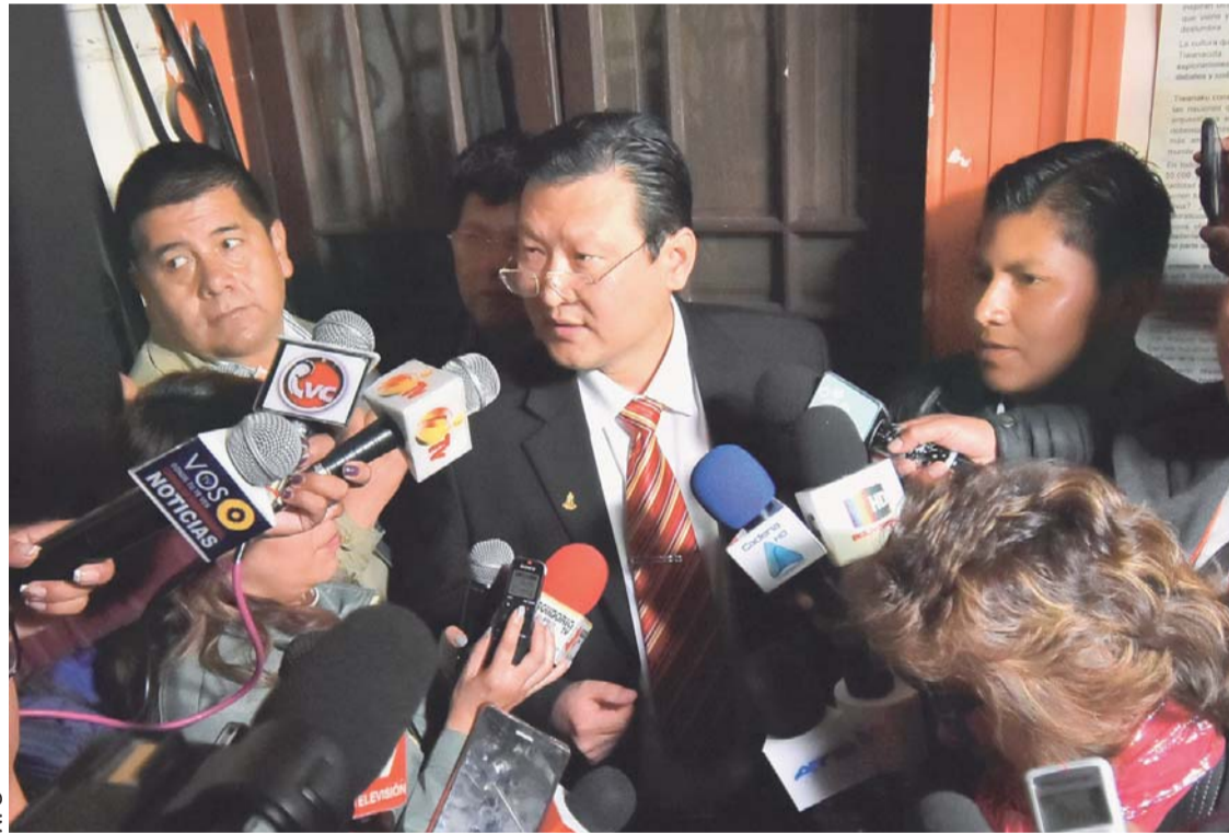
CHI HYUN CHUNG ASEGURÓ SU PARTICIPACIÓN EN LAS ELECCIONES GENERALES COMO CANDIDATO A LA PRESIDENCIA POR PDC.

“En este momento estamos reunidos, recién se va definir (al candidato), yo no entiendo de dónde salió esa información. No (teníamos conocimiento), ayer estábamos reunidos en Cochabamba. No se puede dar una circunstancia así. Entendemos que es el grupo de Chi que ha generado esta información, yo creo,