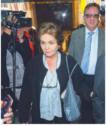
CITADOS A DECLARAR.